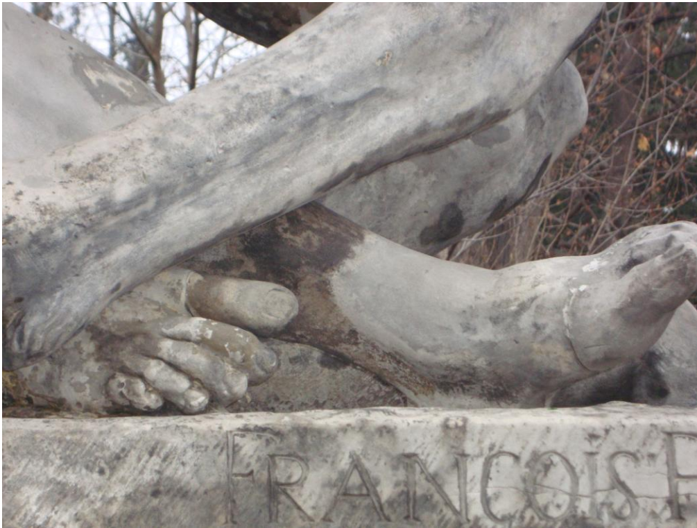
Fot nr 5 Stopy skazańca znajdującego się bliżej widza – fragment, rekonstrukcji prawego kciuka