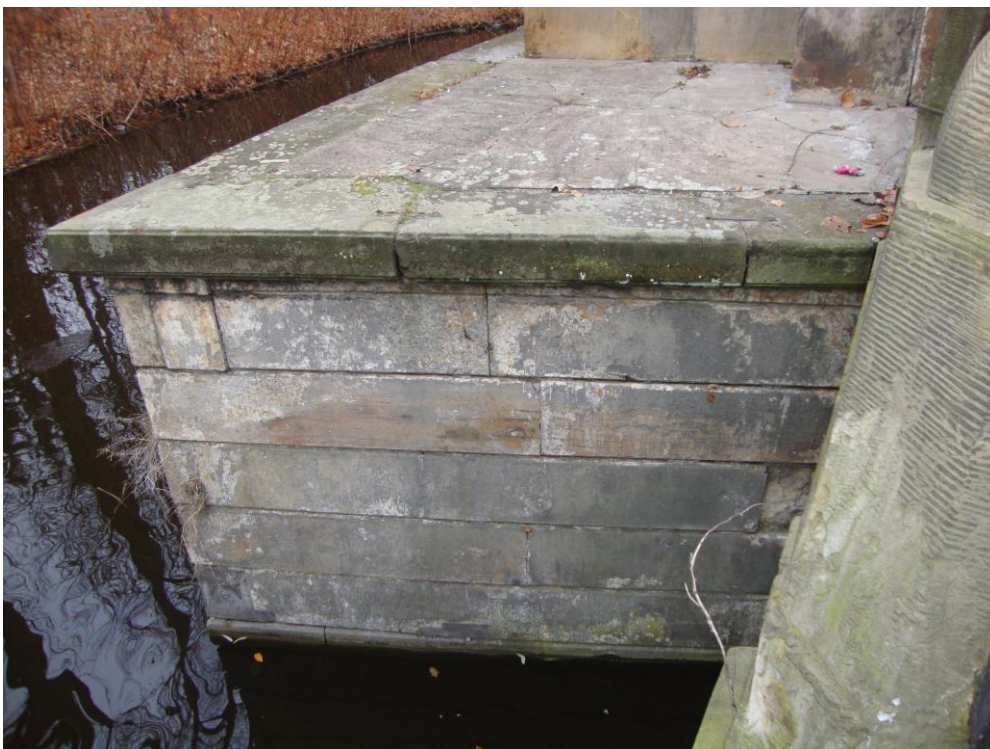
Fot. nr 13 Północny człon z arkadą – od góry zalany wylewką betonową