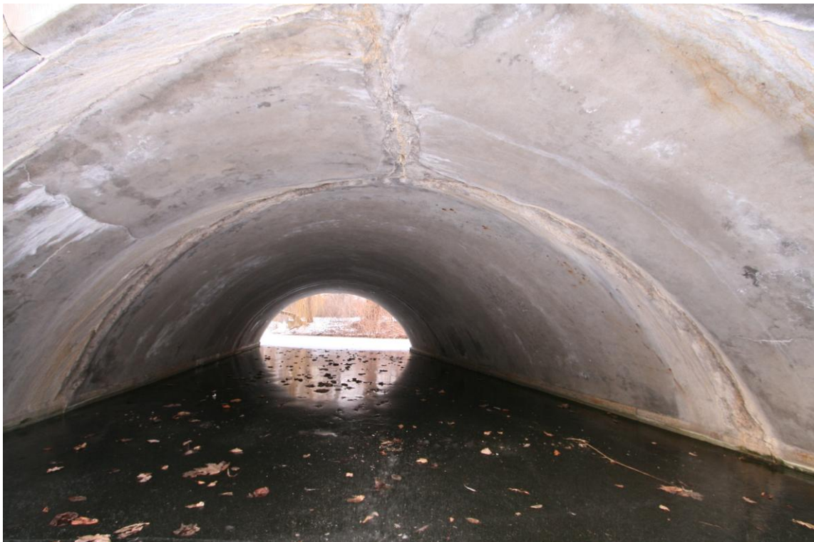
Fot. nr 22 Widok środkowego sklepienia od strony północnej –liczne spękania warstwy tynku