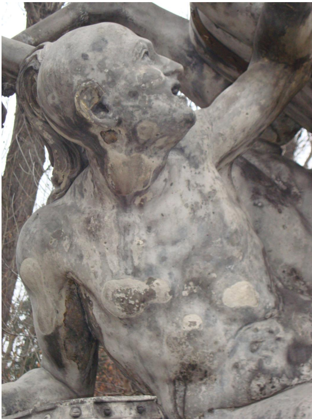
Fot. nr 4 Widok skazańca - fragment, szaro-czarne zacieki, nieestetyczny flek w partii ucha