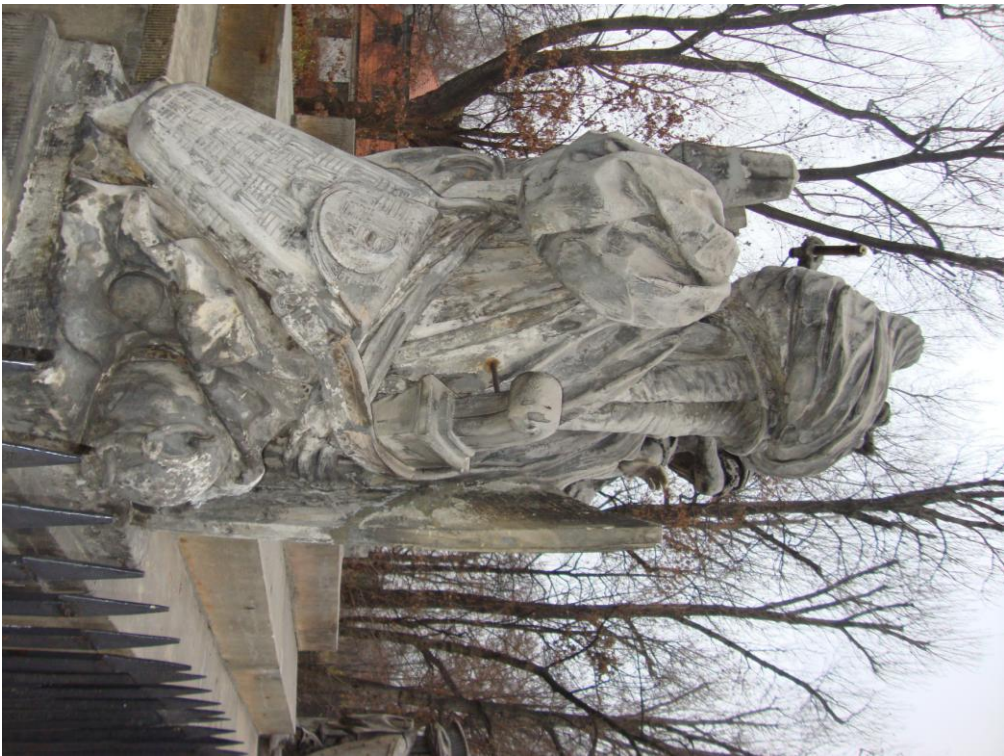
Fot. nr 7,8 Widok ogólny panoplium od strony zachodniej