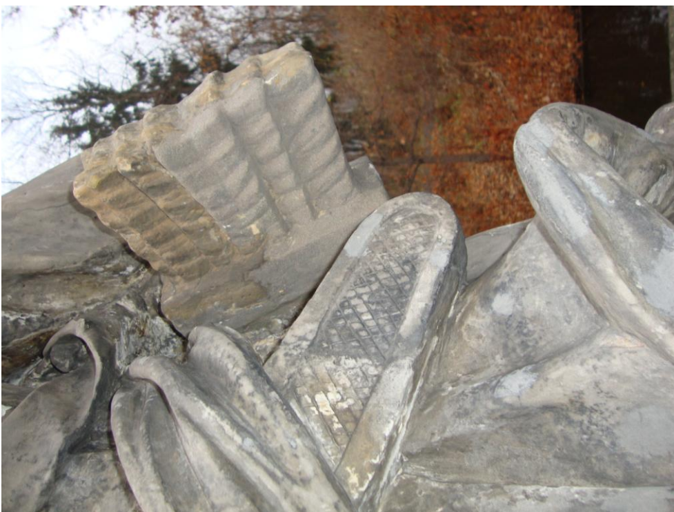
Fot.11 Panoplium od strony wschodniej – widok ogólny