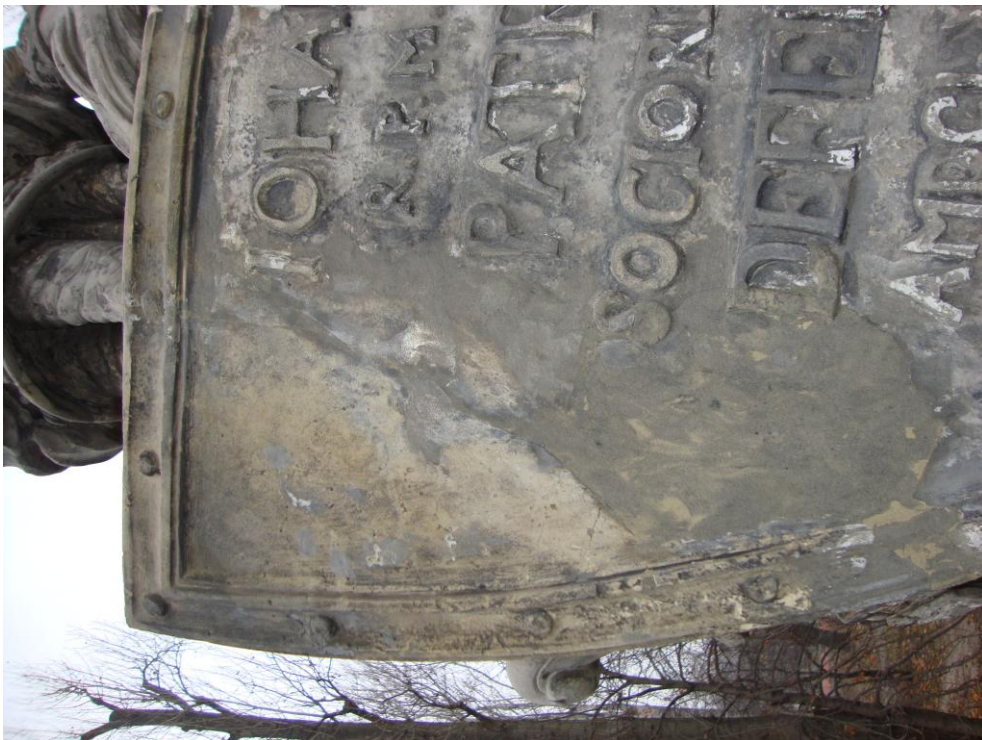
Fot. nr 9 Zbliżenie na dolną część tarczy panoplium znajdującego się po stronie zachodniej – współczesne inicjały