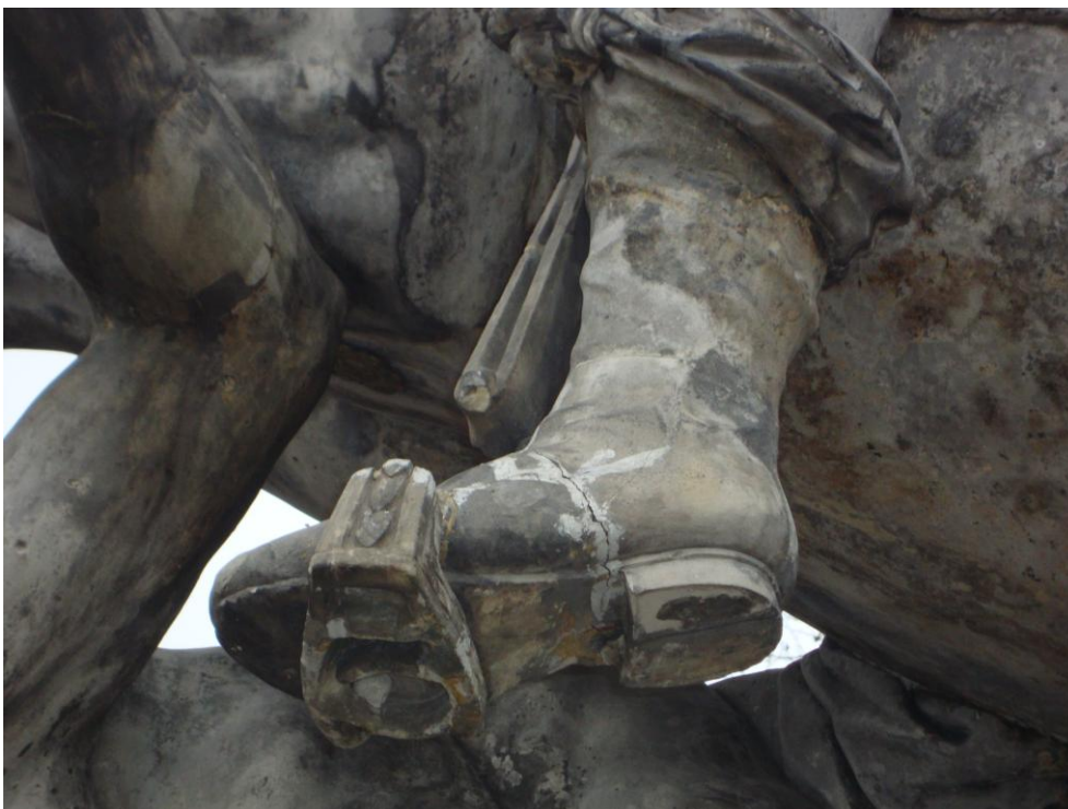
Fot. nr 2 Pęknięcia w lewej stopie Jana III Sobieskiego, ubytki strzemienia