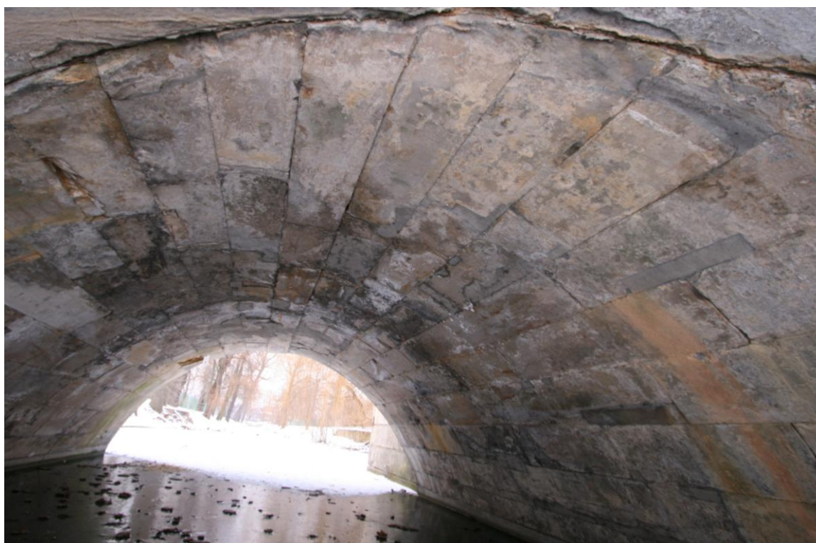
Fot nr 20 Widok ogólny zachodniego sklepienia od strony północnej