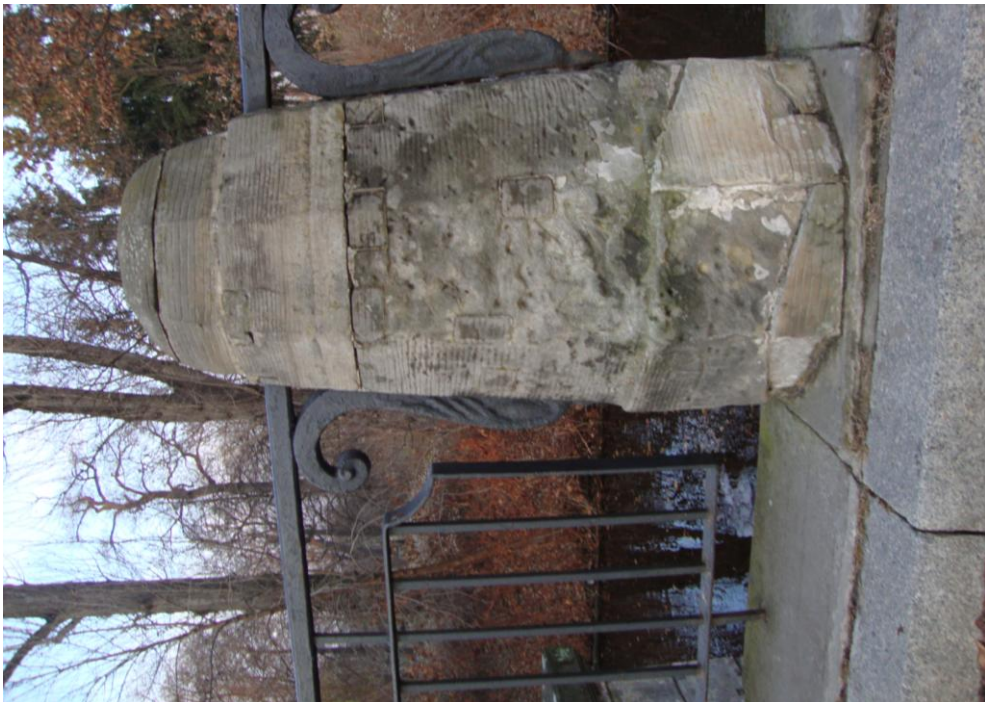
Fot. nr 15, 16 Widok ogólny słupków od strony południowej