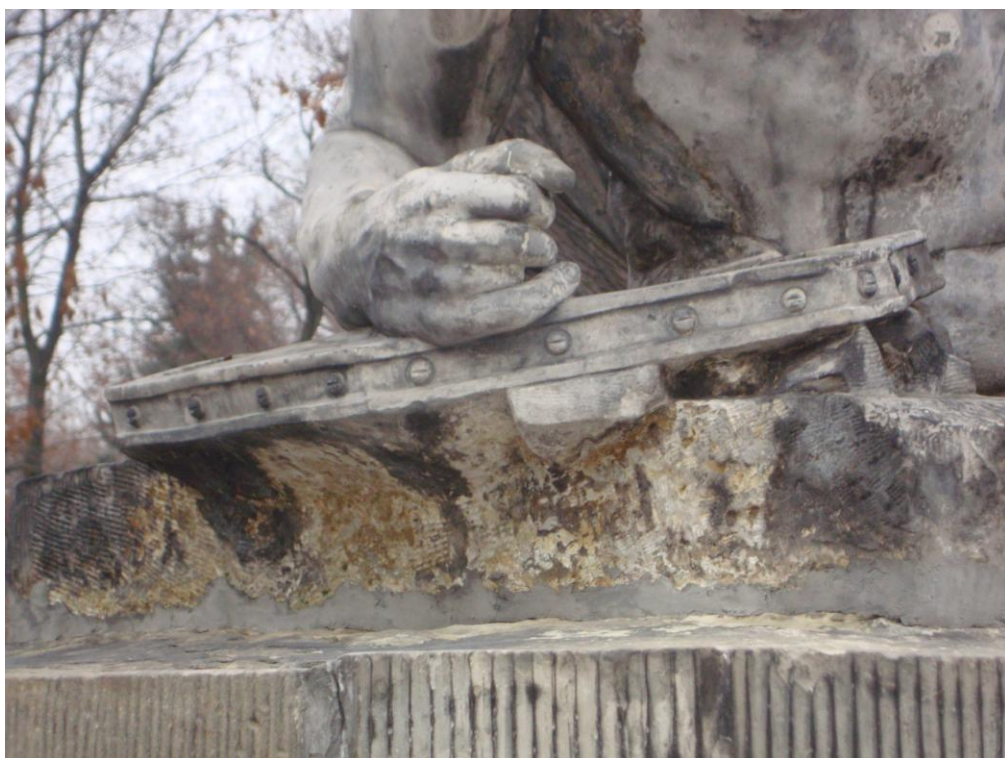
Fot nr 6 Fragment postumentu pod rzeźbę, widoczne wtórne przekucia, fugi cementowe