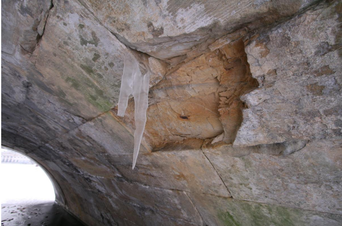
Fot nr 21 Widok zachodniego sklepienia od strony północnej – zbliżenie