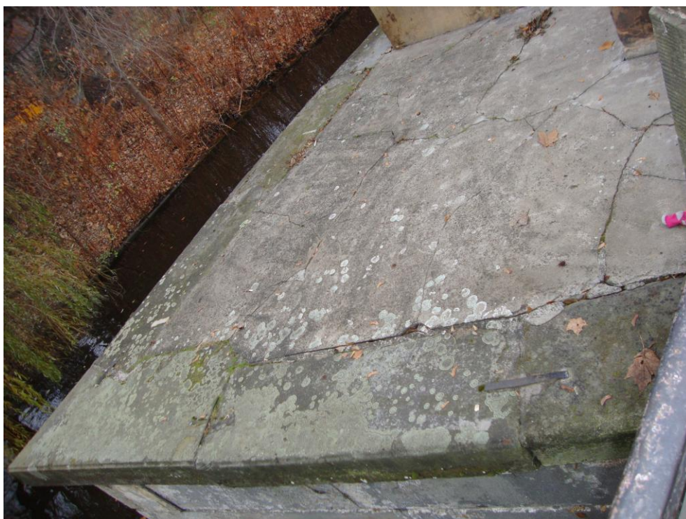
Fot. nr 14 Północny człon z arkadą - widok od góry.