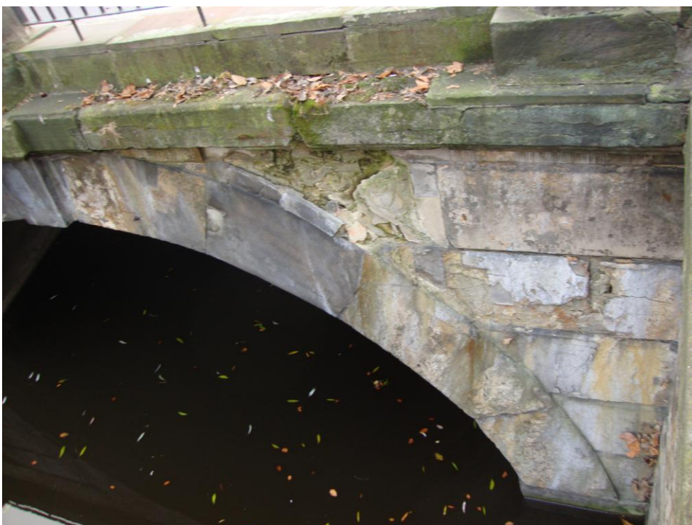
Fot. nr 18 Fragment mostu od strony północnej- osypujący, rozwarstwiający się kamień w partii arkad