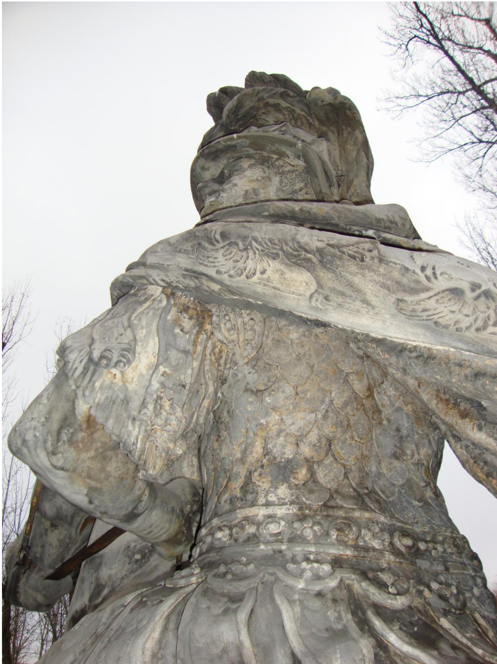
Fot. nr 3 Fragment zbroi Jana III Sobieskiego – pozostałości żółtej farby (?)