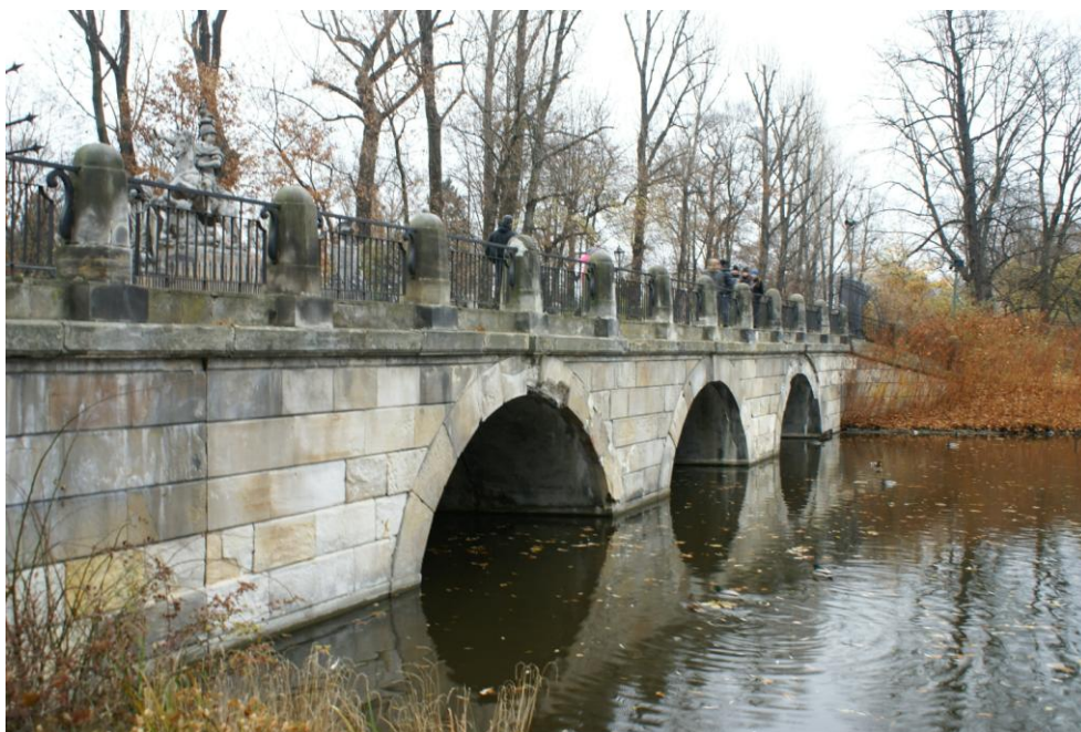
Fot. nr 17 Widok ogólny mostu od strony południowej