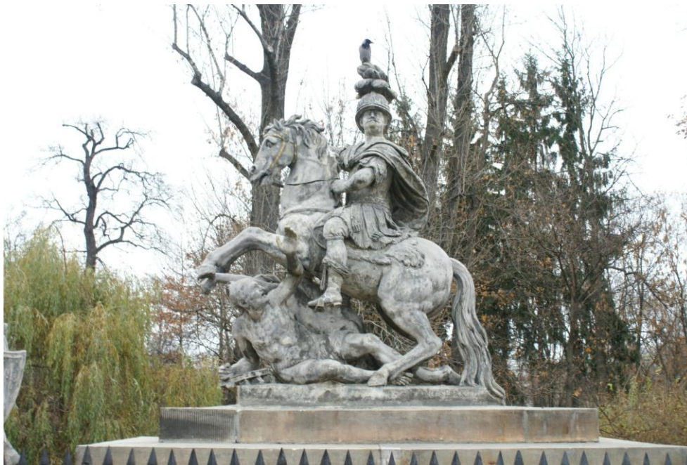
Fot. nr1 Pomnik Jana III Sobieskiego od strony południowej – widok ogólny