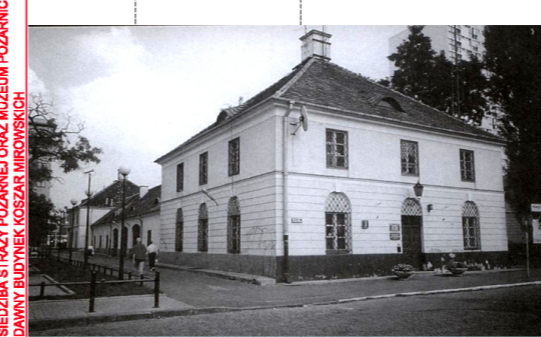
SIEDZIBA STRAŻY POŻARNEJ ORAZ MUZEJUM POŻARNICTWA DAWNY BUDYNEK KOSZAR MIROWSKICH