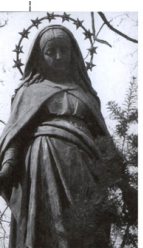
NEOROMANTYSCY KOSCIÓŁ p.w. Św. BOROMIEJUSZA PO XAW. JERZ. HENRYK MARCINI