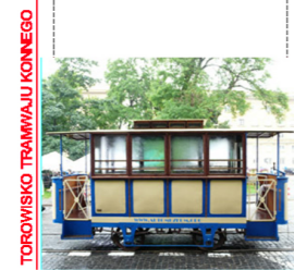
TOROWISKO TRAMWAJU KONNEGO